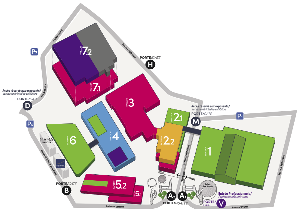
Plan arrêté au 15/09/2024, susceptible de modifications / Plan as at 2024/09/15, subject to modifications.